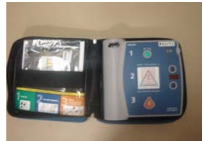
ハートシム ACLSトレーニングシステム1式 (中古販売で破格の39万円:通常は約200万円)