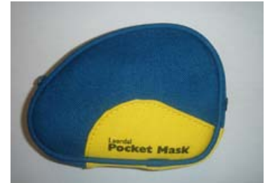
ポケットマスク(青)ソフトポーチ入り 2,000円