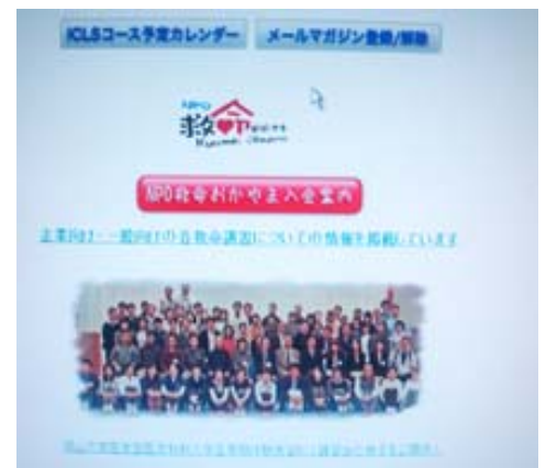
NPO救命おかやま オフィシャルHP http://npo-ok.umin.jp/

HPは随時アップデートしております。新たな発見や新情報に御期待頂き、時々閲覧して頂ければと思います。今後とも宜しくお願い致します。