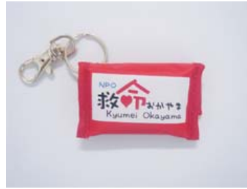
救命おかやまロゴ入り フェイスシールドキーリング 500円